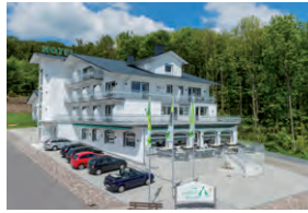
LANDHOTEL KRISTALL BAD MARIENBERG