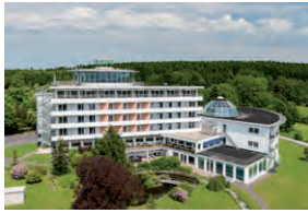
WILDPARK HOTEL BAD MARIENBERG