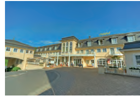
HOTEL LAHNSCHLEIFE WEILBURG